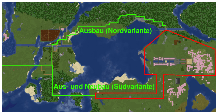
Abbildung 2: Planfeststellungsabschnitt Mitte