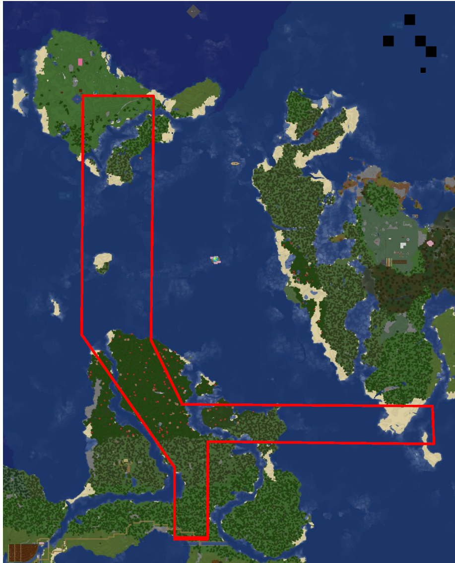
Abbildung 3: Planfeststellungsabschnitt Nordost